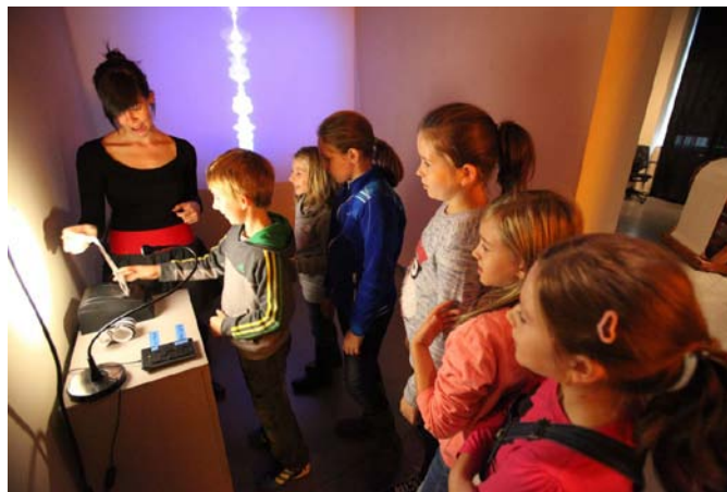
Prohlídka s komentářem, Výstava Na film!, Museum Montanelli, 2015

Každopádně je to složité, ale zpět k vašim aktivitám. Před rokem jste uskutečnili první výstavu v prostorách Musea Montanelli. Letos