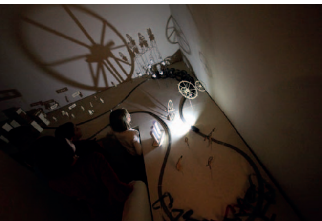
Expozice české filmové avantgardy, Výstava Na film!, Museum Montanelli, 2015

AM: Filmová muzea se nám vlastně nikdy úplně nelíbí. Vždycky na nich vidíme spíš nedostatky. Buď jsou