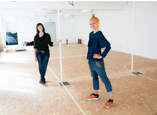
Nové prostory pro Výstavu Na film! 2: V pohybu, Palác Chicago, 2016